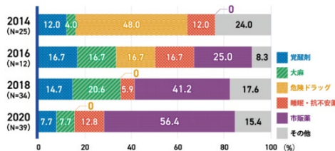
図4. 全国の精神科医療施設における薬物依存症の治療を受けた10代患者の「主たる薬物」の推移

このような背景から、きっと自らを危険にさらす行為を食い止めようとドラッグストア等では確認をする様になったのですね。(N. K)